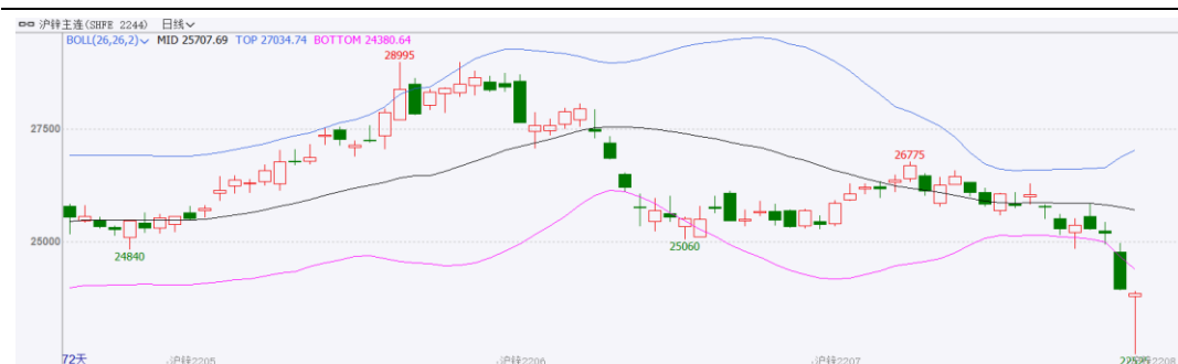
图表 1：沪锌主力合约走势图