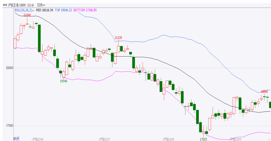
图表1：沪铝主力合约走势图

本周，沪铝主连开盘价18510元/吨，收盘价18725元/吨，周涨210元/吨，或1.13%。波动范围18280~18880元/吨。成交量减少386006手至1449590手，持仓量减少5198手至170334手。