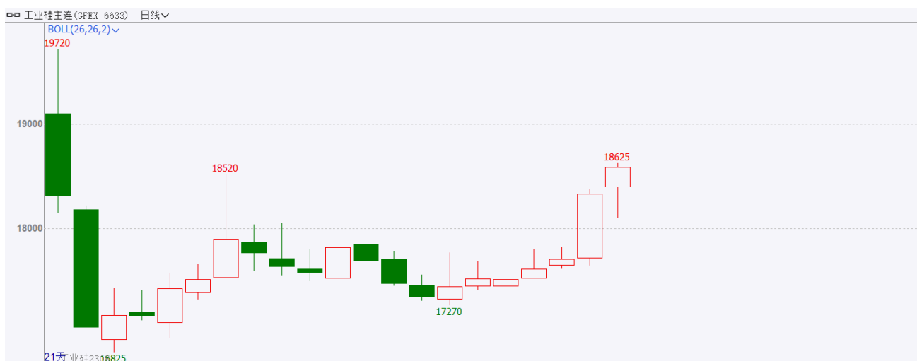
图表 1：工业硅期货主力合约走势图

1月，工业硅期货主力合约2308先抑后扬，开盘价17870元/吨，收于18590元/吨，月涨695元或3.88%，波动范围：17270~18625元/吨。成交量增加19.9万手至36.8万手，持仓量增加84162手至91870手。