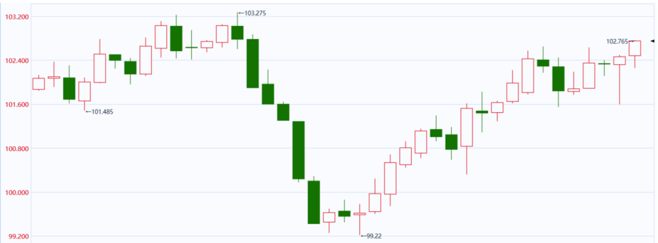
图表 2：美元指数走势图