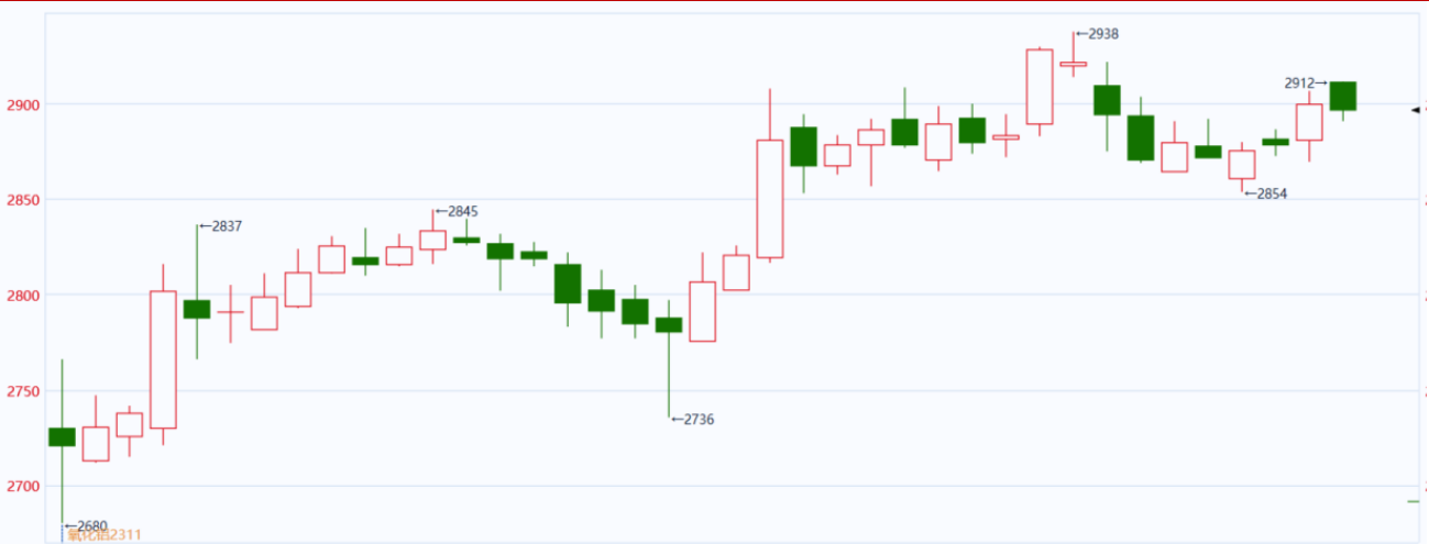
图表 3：氧化铝主连走势图

本周，氧化铝小幅回升，开盘价 2865 元/吨，收于 2900 元/吨，周涨 35 元或 1.01%，波动范围：2854-2907 元/吨。成交量减少 6 万手至 21.73 万手，持仓量减少至 6.82 万手。从图形上看，氧化铝目前在 2900 整数关口震荡整理。