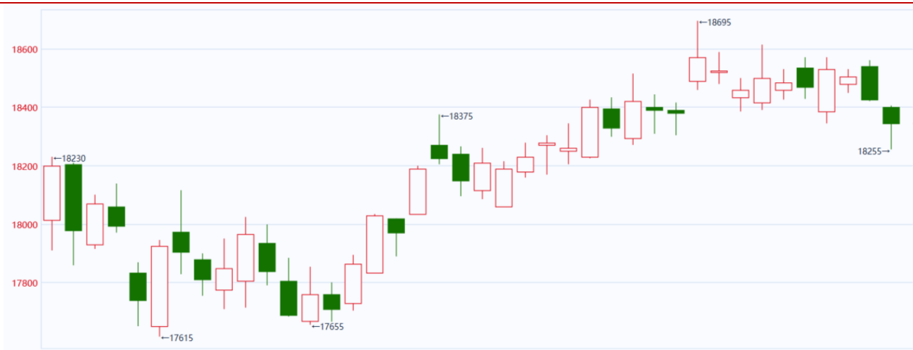
图表 1: 沪铝主连走势图

本周(8.7-8.11),沪铝主力合约震荡回落。开盘价 18400 元/吨, 收盘价 18345 元/吨, 周跌 55 元/吨, 或 0.43%。波动范围 18225~18405 元/吨。成交量大幅降低至 10.01 万手, 持仓量减少 10646 手至 20.67 万手。